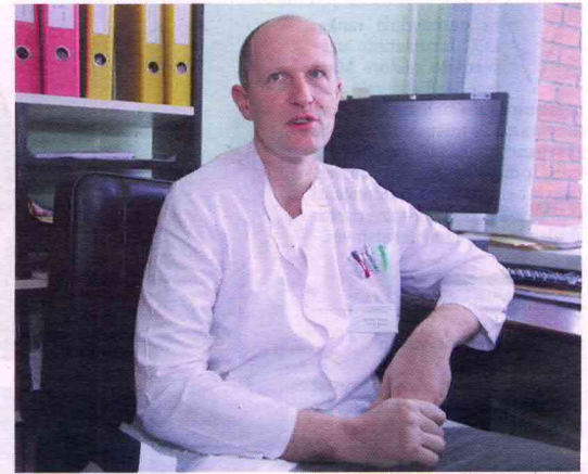
■ Vengia: R.Venckaus manymu, moterys daro klaidą, nesikreipdamos pagalbos dėl šlapimo nelaikymo.

Esant žymiam tarpvietės prolapsui, vienintelis efektyvus gydymas – operacija. Šios ligos atveju taikomos priekinės ar užpakalinės makšties sienelių iplėšos, makšties sienelių susiuvimai, gimdos pašalinimas, Mančesterio operacija, kai